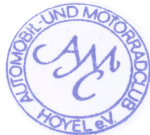
Stempel des Veranstalters