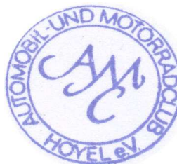
Stempel des Veranstalters